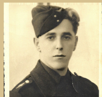
Photo: mon père, incorporé de force dans la Wehrmacht à l'âge de 17 ans

Le Centre culturel franco-allemand de Tours ( https://www.franco-allemand-touraine.eu/ ) m'accueille pour la seconde fois dans ses locaux pour une conférence sur ces mosellans et alsaciens, qui, à partir de 1942, furent incorporés de force dans la Wehrmacht ou la Waffen SS, sous peine de représailles envers leur famille.