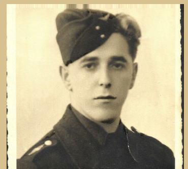
Foto: mijn vader, dienstplichtig bij de Wehrmacht op 17-jarige leeftijd

Het Frans-Duits Cultureel Centrum in Tours ( https://www.franco-allemand-touraine.eu/ ) ontvangt me voor de tweede keer in haar gebouwen voor een lezing over de Moezel- en Elzasbewoners die vanaf 1942 gedwongen werden ingelijfd bij de Wehrmacht of de Waffen SS, op straffe van represailles tegen hun families.